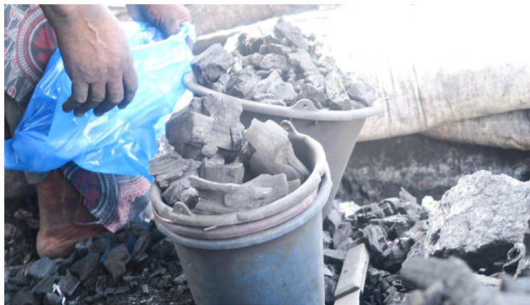
Photo 2 : Une vendeuse de charbon de bois prépare un sac de 500 francs CFA. Cette quantité permet de préparer quelques repas.

marché de Sipores, Yopougon, décembre 2022.